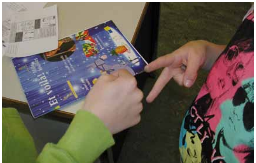
Neue Unterrichtsart mit «mille-feuilles» und «New World»