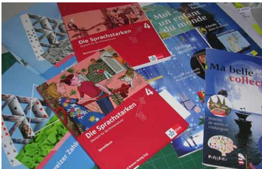
Mit der Einführung mehrerer neuer Lehrmittel nimmt die Vorbereitungszeit automatisch zu!

ein, um die Forderungen genauer zu besprechen.