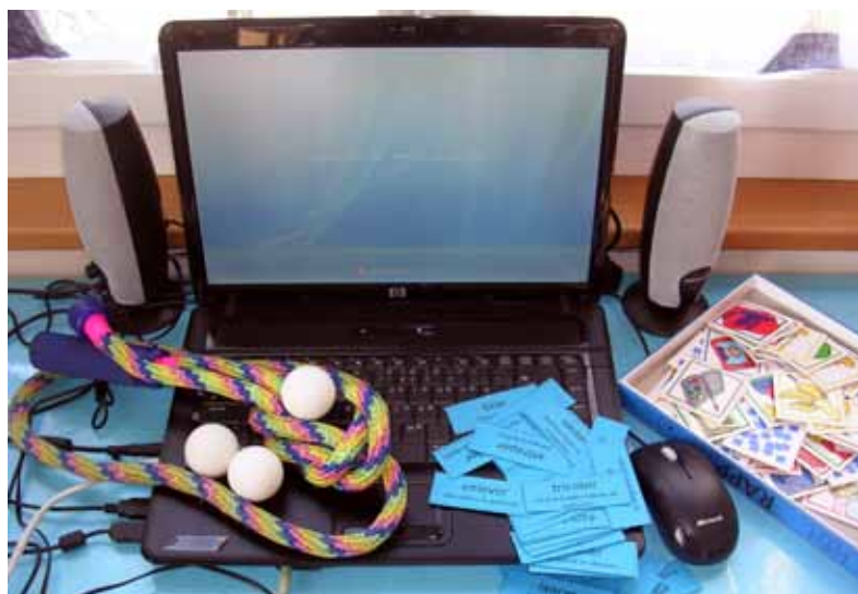
Bewegendes Lernen oder mit dem Computer oder doch spielerisch?